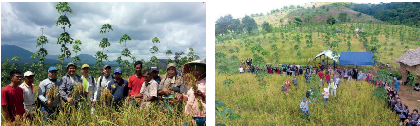
Gambar 1 : Kegiatan Panen Padi di Areal HKM Tebing Siring

Hutan Kemasyarakatan di Desa Tebing Siring, Kecamatan Bajuin di kawasan Hutan Lindung Gunung Langkaras seluas 160 Ha dan Hutan Rakyat di Telaga Langsung, Kecamatan Takisung seluas 400 Ha telah membuktikan bahwa persoalan alang-alang dapat diselesaikan dengan cara membangun agroforestry (dalam hal Hkm Tebing Siring dengan karet dan saat ini telah berhasil ditanam sebanyak 40.000 batang berumur 4 tahun oleh dua Kelompok Tani Hutan atau KTH Ingin Maju dan KTH Suka Maju), dan di HR Desa Telaga Langsung, dengan berbagai kombinasi jenis tanaman cepat tumbuh seperti kaliandra bunga merah, mahoni, gliricidea, beringin, sekaligus dengan pengembangan lebah madu.