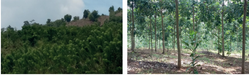
Gambar 2 : Alang-alang tertutup dengan gliciridea dan kaliandra (kiri). Agroforestri karet umur 4 tahun dan kopi (kanan)