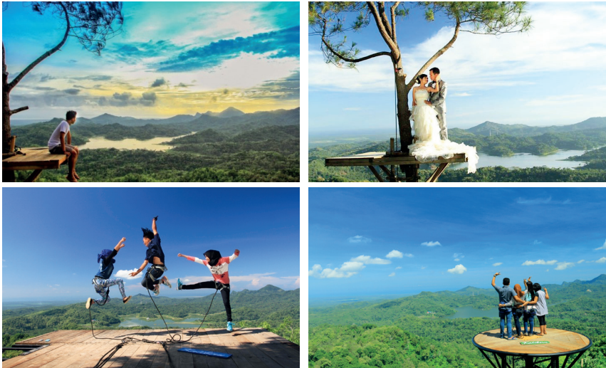
Gambar : Keindahan landscape alam ciptaan Tuhan dan kisah sukses hutan rakyat di Kab.Kulonprogo, sudah seharusnya kita sukuri, jaga, dan lestarikan, karena itu titipan generasi mendatang yang berhak menikmatinya..” (Wiratno : Keadilan Lintas Generasi, 26 Februari 2017)

Publik lebih mengenal obyek wisata Kalibiru daripada Hutan Kemasyarakatan Kulonprogo. Hal ini karena begitu terkenal Kalibiru yang sebenarnya dimulai dari dibangunnya tempat selfie atau Selfie Spot berupa sebuah platform kayu yang ditempatkan pada sebatang pohon pinus. Seorang pengunjung harus naik di atas platform itu dengan pemandangan yang indah landscape waduk sermo dengan hutan rakyat yang menghijau jauh di bawah sana.